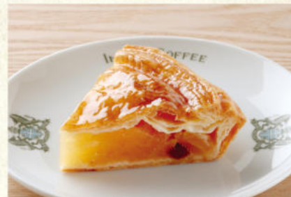
アップルパイ 単品¥740