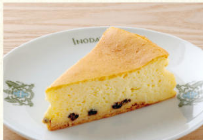
チーズケーキ 単品¥740