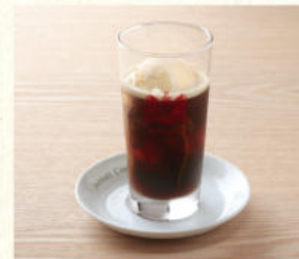
コーヒーフロート Coffee Float

表示価格には消費税が含まれております。(An excise is included in the display price.) 原材料(アレルギー表示)については係員にお尋ねください。