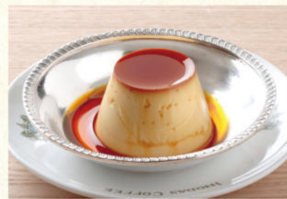
プリン Custard Pudding