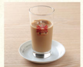
アイスカフェオーレ Iced Café au lait