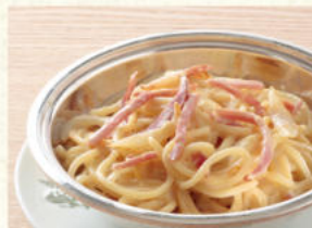
ボルセナ(ホワイトソース) Spaghetti Bolsena(White Sauce)