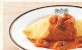
オムライス (エビクリームソース) Omelet with Ham Pilaf (Sauce Americaine)