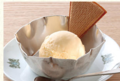
レモンアイス Lemon Ice Cream

表示価格には消費税が含まれております。(An excise is included in the display price.) 原材料(アレルギー表示)については係員にお尋ねください。