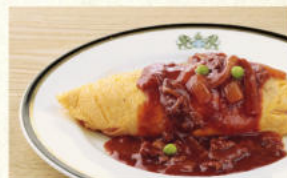
オムライス (ハヤシソース) Omelet with Ham Pilaf (Hashed Beef Sauce)