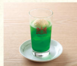
クリームソーダ Melon Soda Float