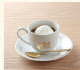
ウィンナーコーヒー Viennese Coffee