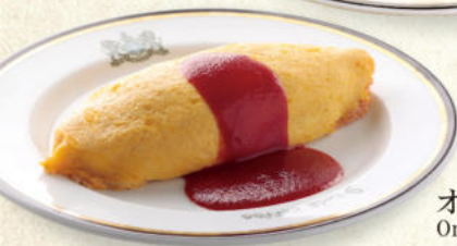
オムライス Omelet with Ham Pilaf