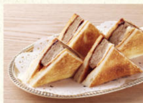
ハンバーグサンド Hamburg Steak Sandwich