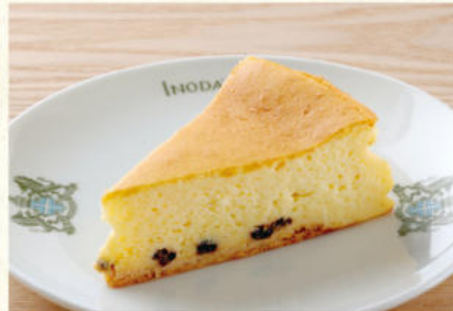
チーズケーキ 単品¥740