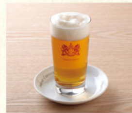
ビール(グラス 334ml) Glass Beer 334ml

表示価格には消費税が含まれております。(An excise is included in the display price.) 原材料(アレルギー表示)については係員にお尋ねください。