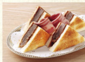
ビーフカツサンド Beef Cutlet Sandwich