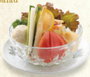
ヤサイミックスサラダ Mixed Vegetable Salad