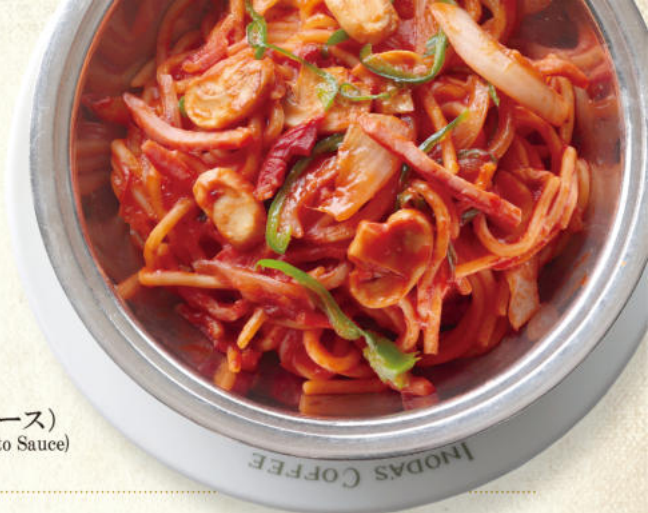
イタリアン(トマトソース) Spaghetti Italian (Tomato Sauce)