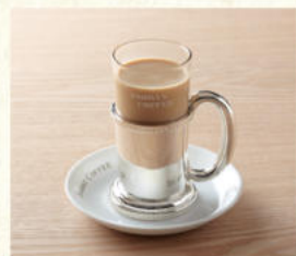
カフェオーレ Café au lait