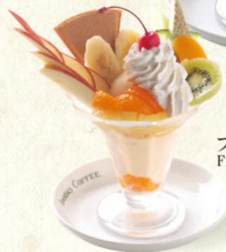
フルーツパフェ Fruit Parfait