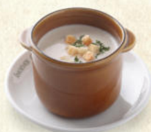
マッシュルームスープ Mushroom Soup