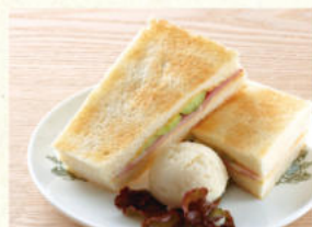
ハムトースト Hot Sandwich (Ham)