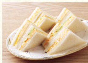
タマゴサンド Egg Sandwich