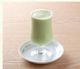
ミックスジュース Mixed Juice