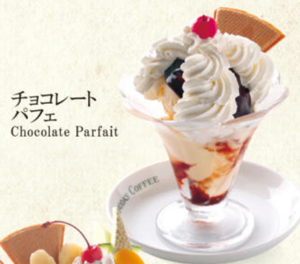
チョコレート パフェ Chocolate Parfait