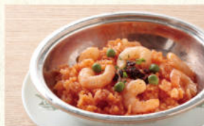
エビピラフ Shrimp Pilaf