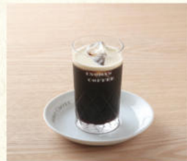
アイスコーヒー Iced Coffee