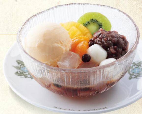
クリームあんみつ豆 Cream Anmitsumame