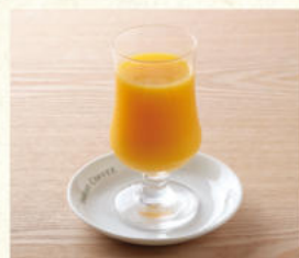
オレンジジュース Orange Juice