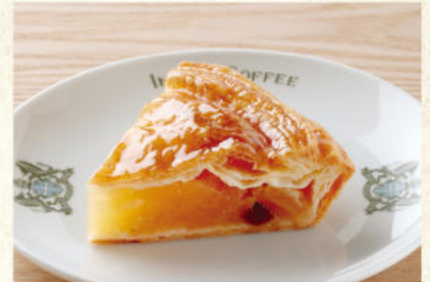
アップルパイ 単品¥740