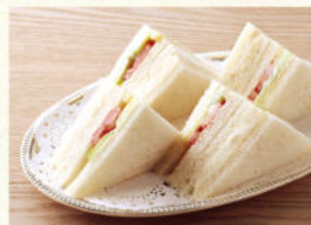
ヤサイサンド Vegetable Sandwich