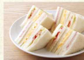
ミックスサンド Mixed Sandwich