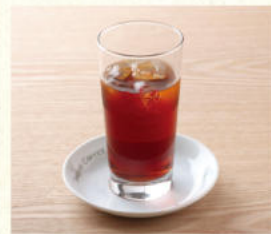
アイスストレートティー Iced Black Tea