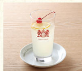
レモンスカッシュ Fresh Lemon Squash