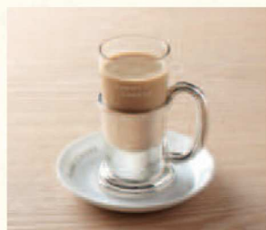
カフェオーレ Café au lait