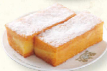
フレンチトースト French Toast