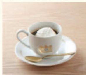
ウィンナーコーヒー Viennese Coffee