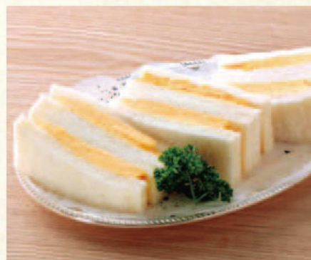
オムレツサンド Omelet Sandwich