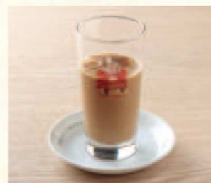
アイスカフェオーレ Iced Café au lait