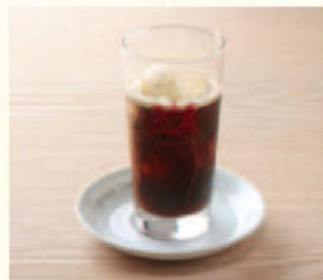
コーヒーフロート Coffee Float