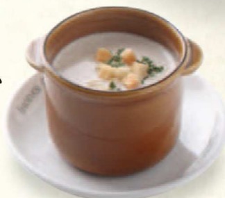
マッシュルーム スープ Mushroom Soup