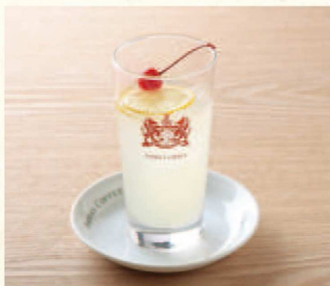
フレッシュレモンスカッシュ Sparkling Fresh Lemonade