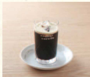
アイスコーヒー Iced Coffee