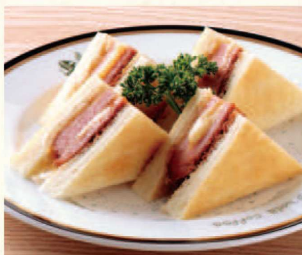
ポークチーズカツサンド Pork Cutlet Sandwich (Pork Luncheon Meat & Cheese)