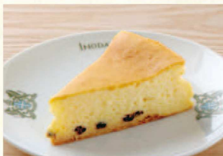
チーズケーキ 単品 ¥710