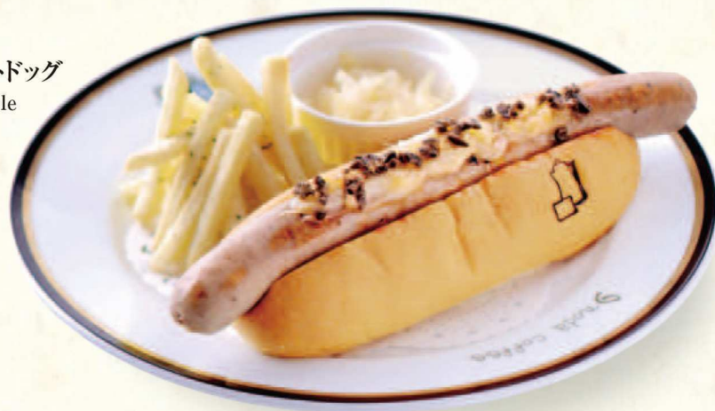
三条ホットドッグ SANJO-style Hot Dog

サクサクジューシーなエビフライのホットドッグ。まろやかタルタルソースの味わいと京都伝統漬物のすぐきが味わいを引き立てる一品。