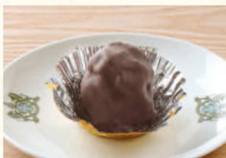
ラムロック 単品 ¥710

国産りんごがたっぷり詰まった昔ながらのアップルパイ。レーズンとシナモンが入っています。