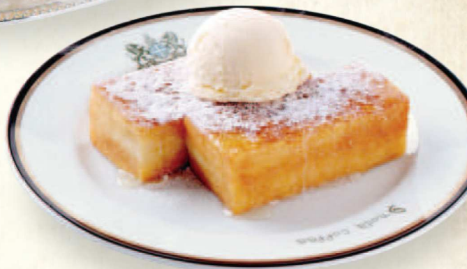
シナモンハニー フレンチトースト Cinnamon Honey French Toast