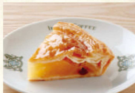
アップルパイ 単品 ¥710