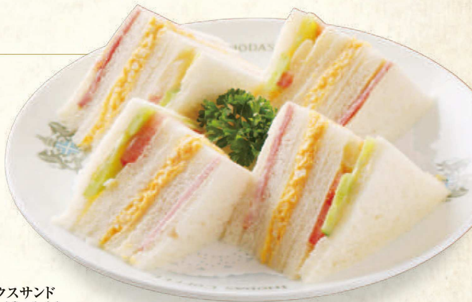
ミックスサンド Mixed Sandwich

ふわふわのオムレツをシンプルに楽しめるサンドウィッチ。卵の豊かな風味とふんわりした食感が絶品。