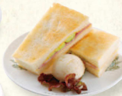
ハムトースト Hot Sandwich (Ham)