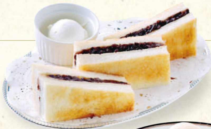
あんバタートースト Toast with Sweet Bean Paste and Butter

定番フレンチトーストにシナモンパウダーとハチミツで風味付け。特製レモンアイスとのハーモニーが絶品。