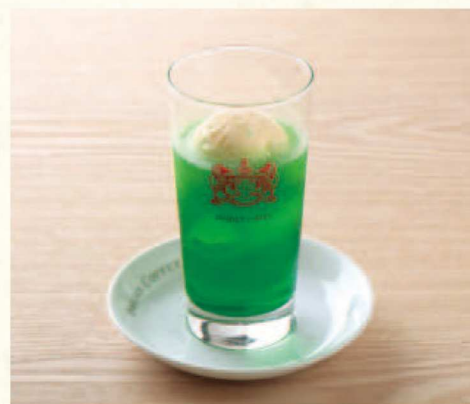
クリームソーダ Melon Soda Float

表示価格には消費税が含まれております。(An excise is included in the display price.) 原材料 (アレルギー表示) については係員にお尋ねください。