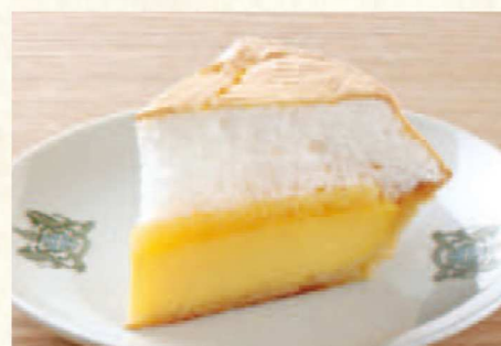
レモンパイ 単品 ¥710