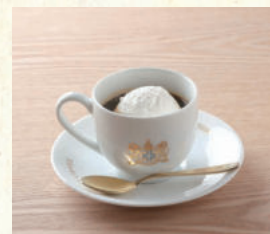
ウィンナーコーヒー Viennese Coffee