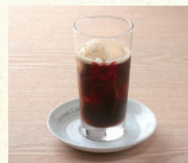
コーヒーフロート Coffee Float

表示価格には消費税が含まれております。(An excise is included in the display price.) 原材料(アレルギー表示)については係員にお尋ねください。