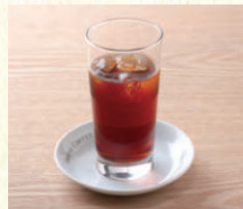
アイスストレートティー Iced Straight Tea

表示価格には消費税が含まれております。(An excise is included in the display price.) 原材料(アレルギー表示)については係員にお尋ねください。