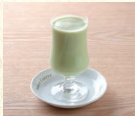
ミックスジュース Mixed Juice