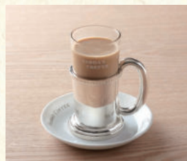
カフェオーレ Café au lait