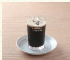
アイスコーヒー Iced Coffee