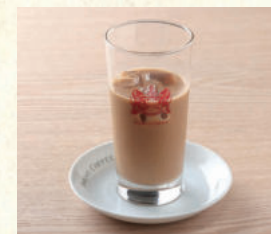
アイスカフェオーレ Iced Café au lait