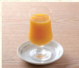
オレンジジュース Orange Juice