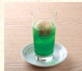
クリームソーダ Melon Soda Float