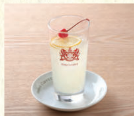
レモンスカッシュ Sparkling Fresh Lemonade