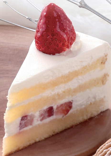
いちごショート Strawberry Layer Cake

シナモン風味のタルト生地に、キャラメルソースを混ぜたアーモンドクリームを詰め、上面にもくるみとキャラメルを乗せて焼き上げました。間にはいちじくのコンフィが入っており、プチプチ感が楽しいケーキになっています。