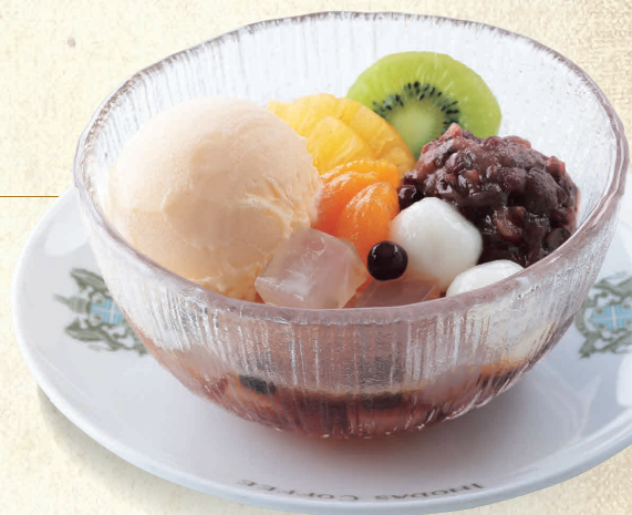
クリームあんみつ豆 Mitsumame topped with Ice Cream and Sweet Bean Paste