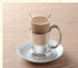
カフェオーレ Café au lait