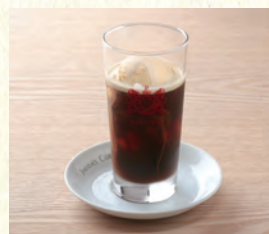
コーヒーフロート Coffee Float