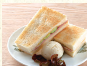
ハムトースト Hot Sandwich (Ham)