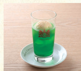
クリームソーダ Melon Soda Float