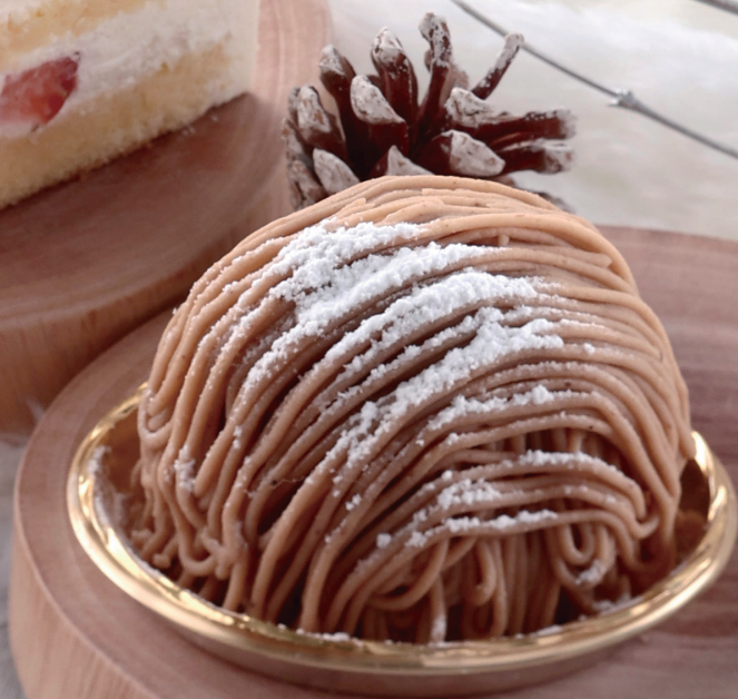
和栗のモンブラン Japanese Chestnut Mont Blanc

国産いちごを使ったショートケーキ。ふんわりやわらかいスポンジ生地に口どけの良い生クリーム、フレッシュないちごを堪能できます。