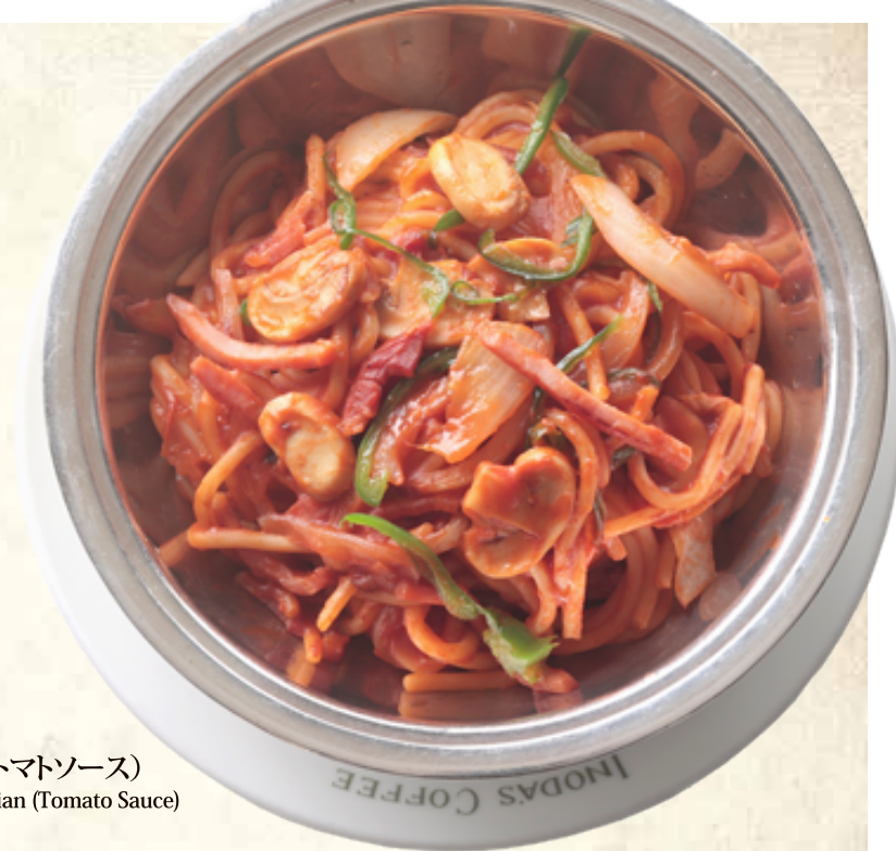
イタリアン(トマトソース) Spaghetti Italian (Tomato Sauce)