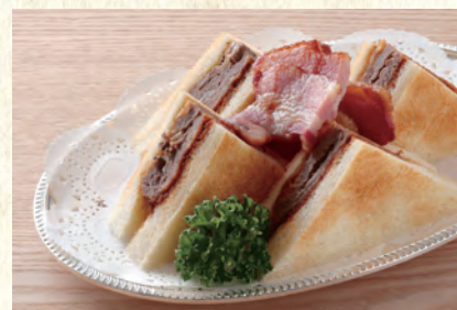
ビーフカツサンド Beef Cutlet Sandwich