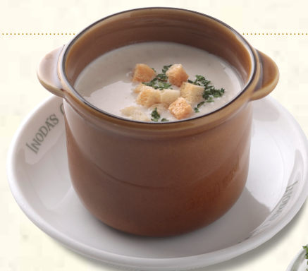
マッシュルームスープ Mushroom Soup