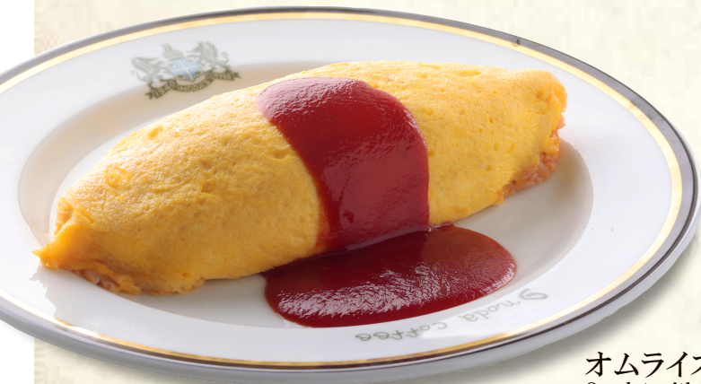
オムライス Omelet with Ham Pilaf