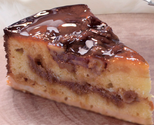
ナッツとキャラメルタルト Nuts and Caramel Tart

シナモン風味のタルト生地に、キャラメルソースを混ぜたアーモンドクリームを詰め、上面にもくるみとキャラメルを乗せて焼き上げました。間にはいちじくのコンフィが入っており、プチプチ感が楽しいケーキになっています。