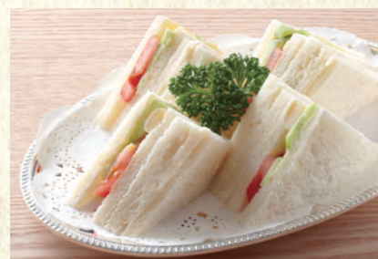
ヤサイサンド Vegetable Sandwich