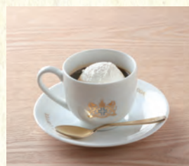
ウィンナーコーヒー Viennese Coffee