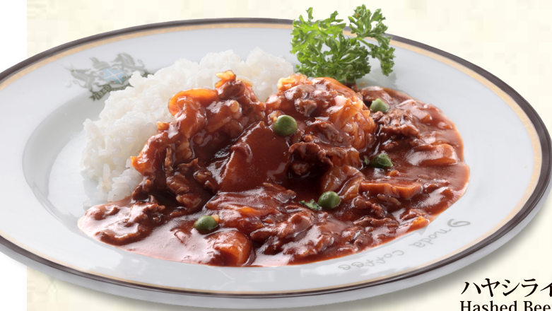
ハヤシライス Hashed Beef with Rice