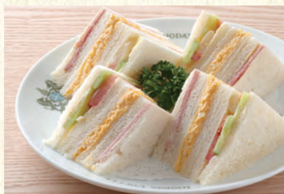
ミックスサンド Mixed Sandwich