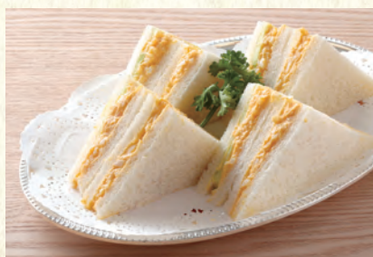
タマゴサンド Egg Sandwich