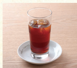
アイスストレートティー Iced Straight Tea