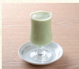
ミックスジュース Mixed Juice