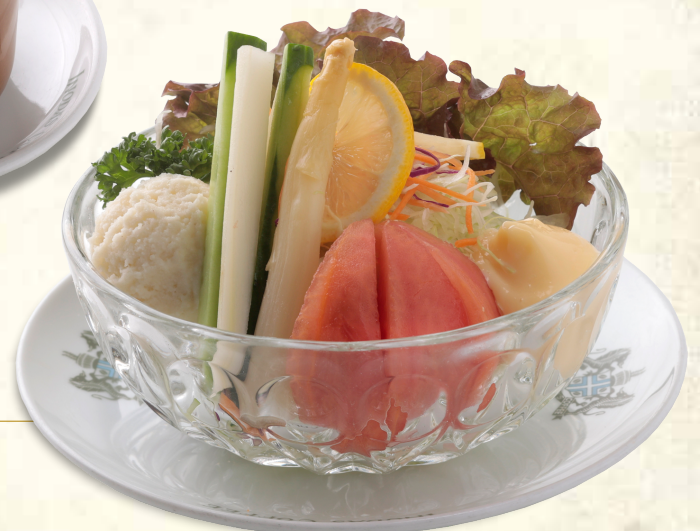
ヤサイミックスサラダ Vegetable Mixed Salad

表示価格には消費税が含まれております。(An excise is included in the display price.) 原材料 (アレルギー表示) については係員にお尋ね下さい。 当店のお米は国産米を使用しております。