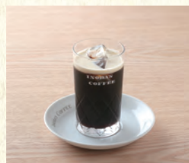
アイスコーヒー Iced Coffee