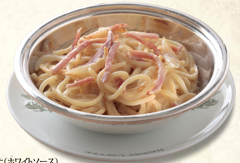
ボルセナ(ホワイトソース) Spaghetti Bolsena (White Sauce)