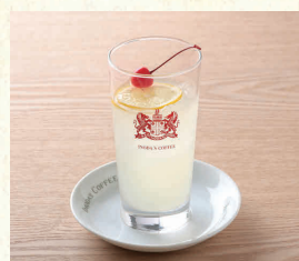
レモンスカッシュ Sparkling Fresh Lemonade