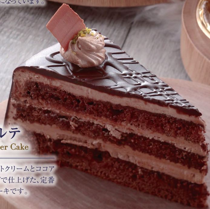
ココアトルテ Chocolate Layer Cake

国産和栗ペーストと、フランス産のペーストを合わせたたっぷり絞ったモンブランです。底にカラメル化するまで焼いたメレンゲを敷き、中央には無糖生クリームに隠れた栗の甘露煮が入っています。