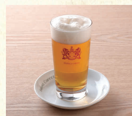
ビール(グラス 334ml) Glass Beer 334ml

表示価格には消費税が含まれております。(An excise is included in the display price.) 原材料(アレルギー表示)については係員にお尋ね下さい。