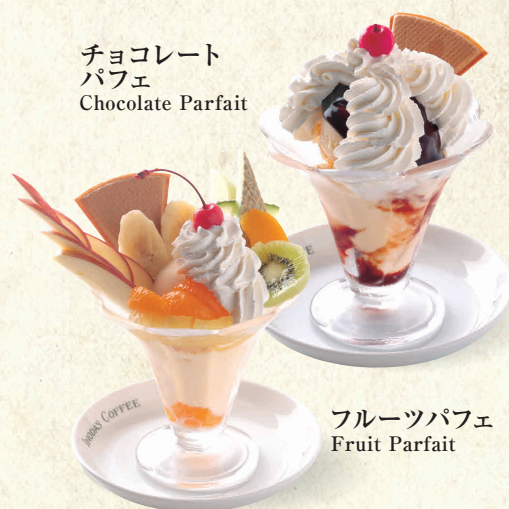
チョコレート パフェ Chocolate Parfait