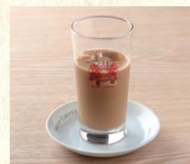
アイスカフェオーレ Iced Café au lait