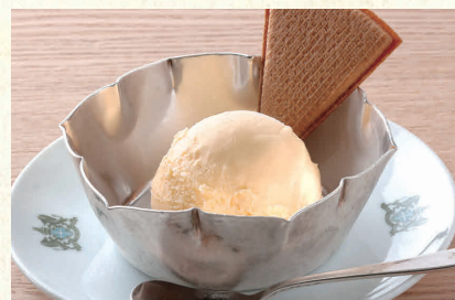
レモンアイス Lemon Ice Cream