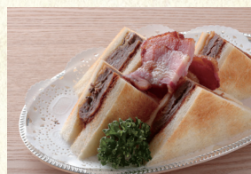
ビーフカツサンド Beef Cutlet Sandwich