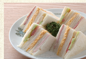
ミックスサンド Mixed Sandwich