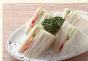
ヤサイサンド Vegetable Sandwich