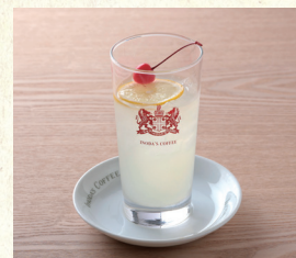
レモンスカッシュ Sparkling Fresh Lemonade