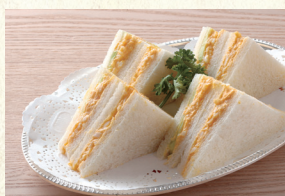
タマゴサンド Egg Sandwich