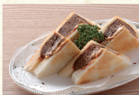
ハンバーグサンド Hamburg Sandwich