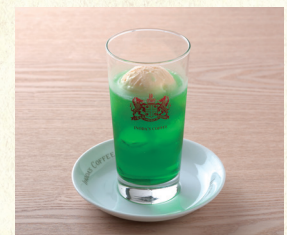
クリームソーダ Melon Soda Float