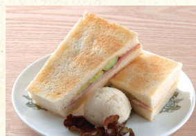
ハムトースト Hot Sandwich (Ham)