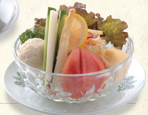
ヤサイミックスサラダ Vegetable Mixed Salad

表示価格には消費税が含まれております。(An excise is included in the display price.) 原材料(アレルギー表示)については係員にお尋ね下さい。 当店のお米は国産米を使用しております。