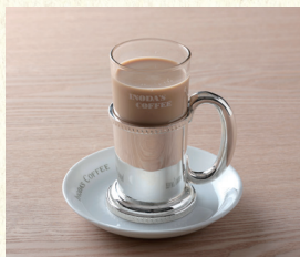
カフェオーレ Café au lait