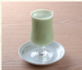
ミックスジュース Mixed Juice