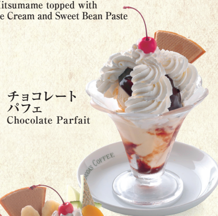
チョコレート パフェ Chocolate Parfait