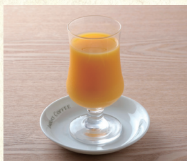
オレンジジュース Orange Juice