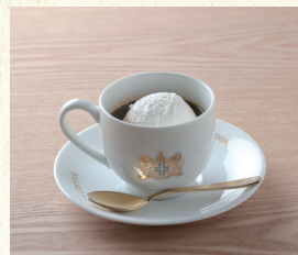
ウィンナーコーヒー Viennese Coffee