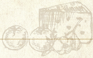
イタリアン(トマトソース) Spaghetti Italian (Tomato Sauce)