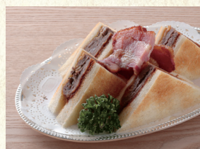
ビーフカツサンド Beef Cutlet Sandwich