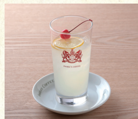
レモンスカッシュ Sparkling Fresh Lemonade