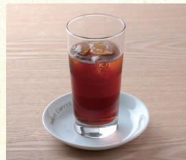
アイスストレートティー Iced Straight Tea