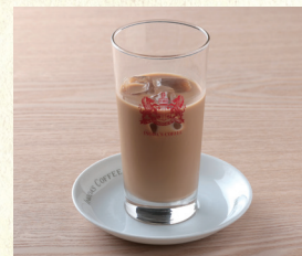
アイスカフェオーレ Iced Café au lait