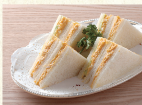
タマゴサンド Egg Sandwich