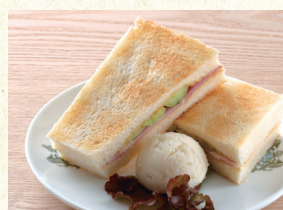
ハムトースト Hot Sandwich (Ham)