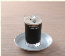
アイスコーヒー Iced Coffee