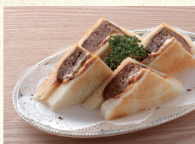
ハンバーグサンド Hamburg Sandwich