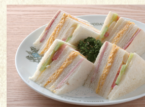
ミックスサンド Mixed Sandwich