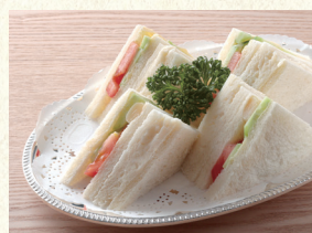
ヤサイサンド Vegetable Sandwich