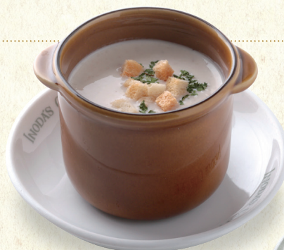
マッシュルームスープ Mushroom Soup