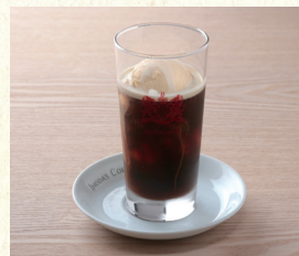
コーヒーフロート Coffee Float