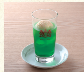
クリームソーダ Melon Soda Float