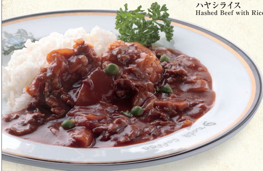
ハヤシライス Hashed Beef with Rice