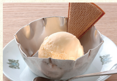
レモンアイス Lemon Ice Cream

表示価格には消費税が含まれております。(An excise is included in the display price.) 原材料 (アレルギー表示) については係員にお尋ね下さい。