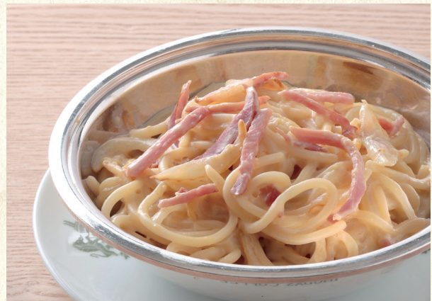
ボルセナ(ホワイトソース) Spaghetti Bolsena (White Sauce)