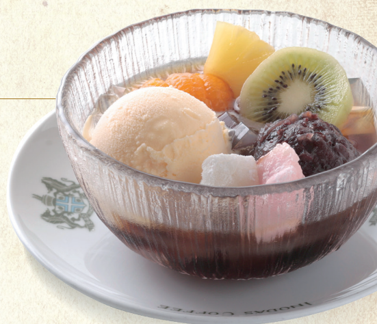
クリームあんみつ豆 Mitsumame topped with Ice Cream and Sweet Bean Paste