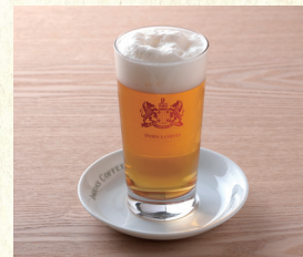
ビール(グラス 334ml) Glass Beer 334ml

表示価格には消費税が含まれております。(An excise is included in the display price.) 原材料(アレルギー表示)については係員にお尋ね下さい。