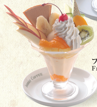
フルーツパフェ Fruit Parfait